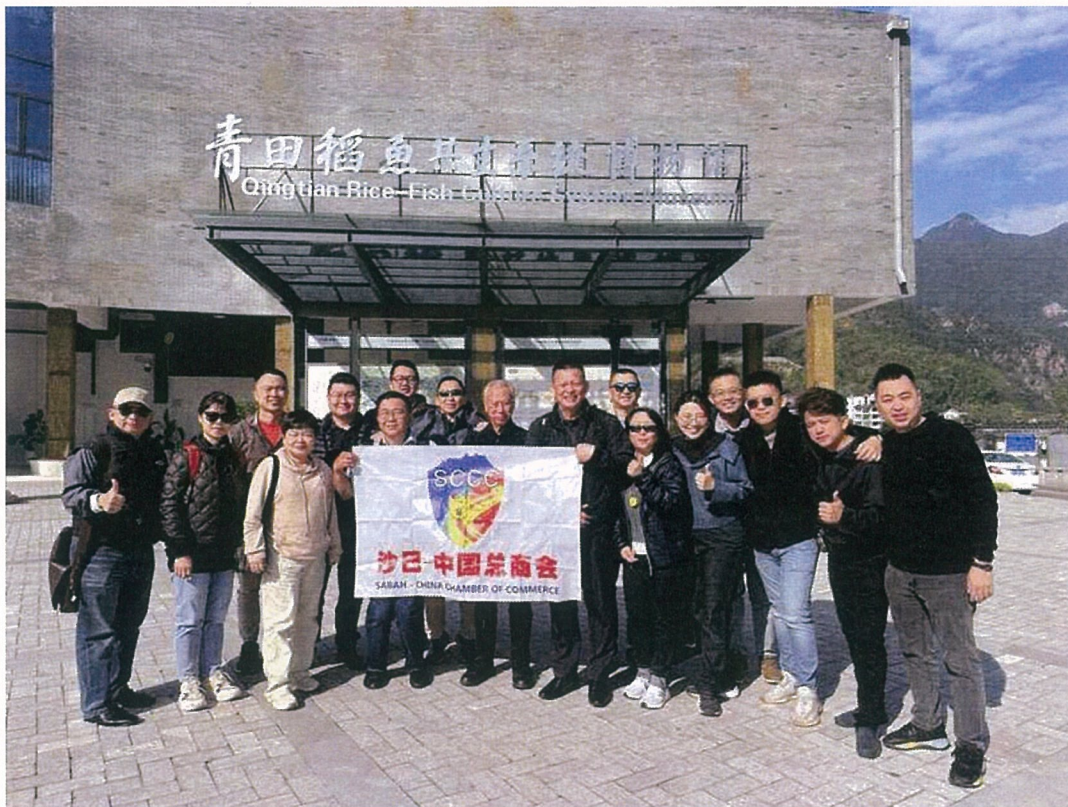
沙中总商会代表参观青田稻鱼共生系统博物馆。

一行人也受邀参与青田县双招双引商务洽谈会、第5届华侨进口商品博览会暨青田进口葡萄酒交易会及第3届国际咖啡博览会。